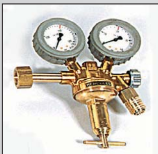
Bild 5: N 2 -Druckminderer, 0 - 20 bar, mit Schnellkupplung und Manometerschutzkappen Art.-Nr. 186801