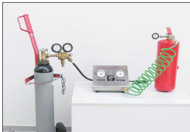
Bild 2: Füllung eines Dauerdruck-Feuerlöschers aus der Stickstoff-Vorratsflasche.