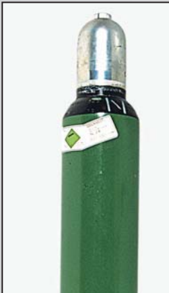
Bild 3: Stahlflasche gefüllt mit 10 l Stickstoff, 200 bar Art.-Nr. 187072