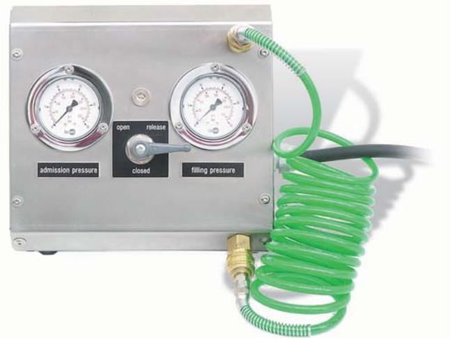
Bild 1: Mit der Stickstoff-Füllanlage SFA können Dauerdruck-Feuerlöscher sicher mit Stickstoff aufgepolstert werden. Das Bild zeigt die Anlage mit angeschlossenem N 2 -Spiralfüllschlauch. Die Anzeige des Vordruck- und des Fülldruck-Manometers ist äußerst präzise.

Nach Beendigung des Füllvorganges wird über den Kugelhahn in der Stellung "ZU" der Spiralfüllschlauch zwangsweise entlastet.