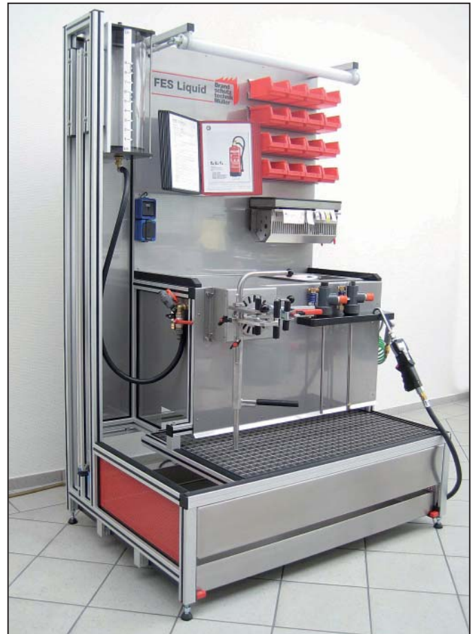
Bild 5: FES Liquid Stationär. (Foto enthält aufpreispflichtiges Zubehör).

Der Arbeitsplatz ist mit zahlreichen Zubehöerteilen individuell ausbaubar.