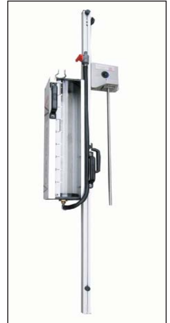
Bild 2: Anbauteil FES Liquid (Art.-Nr. 186725) mit durchsichtigem Prüfbehälter 9 Liter und Balancer zur leichten Höhenverstellung des Prüfbehälters. Das Anbauteil kann nach Lösen einer Handschraube abgenommen und auch an eine vorhandene DSV Mobil nachgerüstet werden.