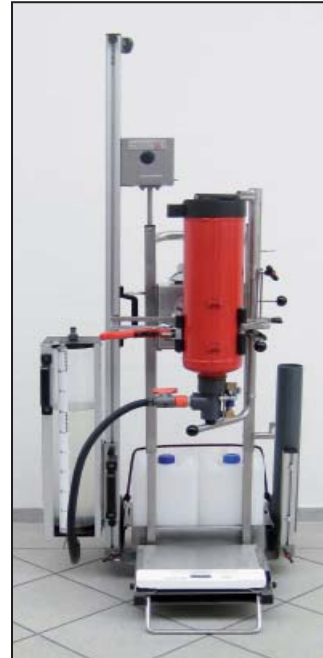
Bild 1: Das FES Liquid besteht aus einer mobilen drehbaren Spannvorrichtung DSV MOBIL aus Edelstahl mit Klemmbügel PA-Fix, dem Anbauteil FES Liquid, einem Entleerungsadapter und einem Füllschlauch. (Foto enthält aufpreispflichtiges Zubehör).

Nachdem der Löschmittelbehälter geprüft wurde, wird das Löschmittel wieder eingefüllt. Hierzu wird der Prüfbehälter, unterstützt durch den Balancer, nach oben gehoben. Das Einfüllen geschieht mit Hilfe eines Füllschlauches, so dass „gegen die Flüssigkeit“ gefüllt wird.