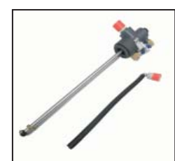
Bild 4: Beispiel für einen Entleerungsadapter (abhängig vom Feuerlöscherfabrikat unterschiedliche Ausführungen). Darunter: Füllschlauch.