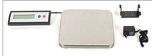
Bild 5: Elektronische Waage mit Digitalanzeige. Batterie- und Netzbetrieb. Netzgerät im Lieferumfang enthalten. Tarafunktion. Plus/Minus- und Entnahmewiegungen.

Abmessungen: 340 mm breit, 280 mm tief, 55 mm hoch Gewicht: 3,5 kg (inkl. Netzgerät) Art.-Nr. 186913