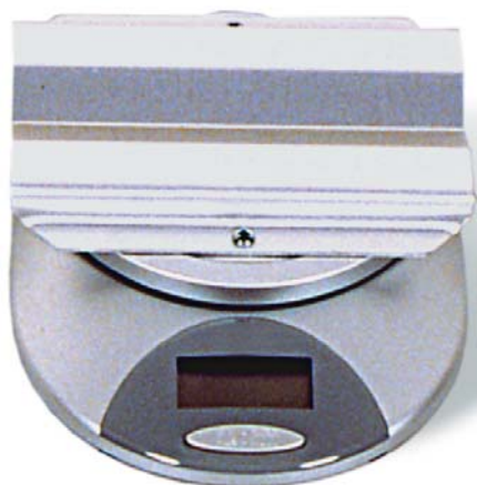
Bild 1: Elektronische Waage mit Digitalanzeige bis 3000 g für CO 2 -Patronen und CO 2 -Flaschen. Batteriebetrieb. Tarafunktion. Ziffernschritt 1 g.

Abmessungen: 140 mm breit, 180 mm tief, 57 mm hoch. Gewicht: 0,365 kg