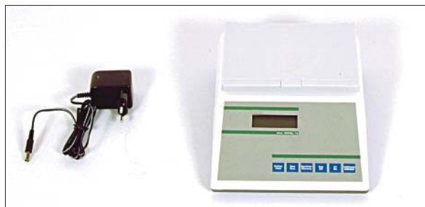
Bild 3: Elektronische Waage mit Digitalanzeige bis 5000 g für CO 2 -Patronen und CO 2 -Flaschen. Batterie- und Netzbetrieb. Netzgerät im Lieferumfang enthalten. Tarafunktion. Ziffernschritt 1 g. Kalibrierfähig.

Abmessungen: 200 mm breit, 245 mm tief, 90 mm hoch