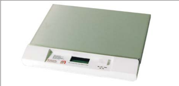
Bild 4: Elektronische Waage mit Digitalanzeige bis 20 kg. Batterie- und Netzbetrieb. Netzgerät im Lieferumfang enthalten. Tarafunktion. Ziffernschritt 10 g.

Abmessungen: 340 mm breit, 280 mm tief, 55 mm hoch Gewicht: 3,5 kg (inkl. Netzgerät) Art.-Nr. 186913