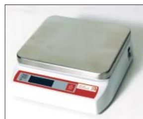
Bild 2: Elektronische Waage mit Digitalanzeige. Kalibrierfähig. Batterie- und Netzbetrieb. Netzgerät im Lieferumfang enthalten.

Abmessungen: 275 mm breit, 310 mm tief, 110 mm hoch Gewicht: 6,7 kg (inkl. Netzgerät)