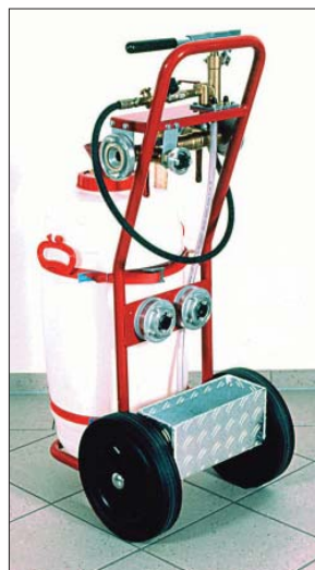
Bild 1 und 2: Mit der manuellen Hydrantenprüfpumpe HPM können Wandhydranten, Steigleitungen und Feuerwehr-Druckschläuche hinsichtlich des Ruhe- und Fließdruckes geprüft werden.

Bei der HPM wird der Prüfdruck manuell mit einer Handpumpe erzeugt. Sie benötigt also keine Elektroversorgung.