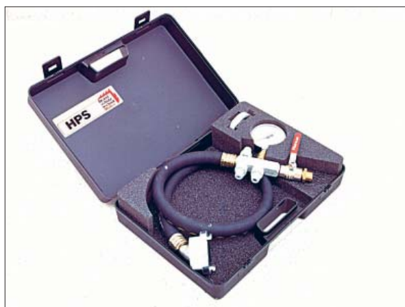
Bild 4: Mit dem Hydrantenprüfset HPS kann an Steigleitungen sowohl der Ruhe- als auch der Fließdruck des Löschwassers gemessen werden.