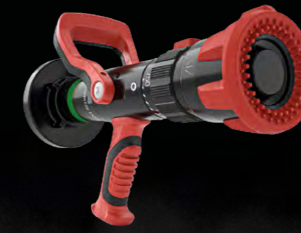
TURBO EVO 950 SPRITZE