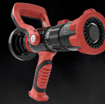
TURBO EVO 400 SPRITZE