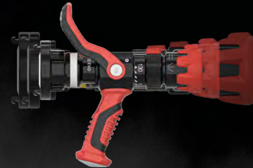
TURBO EVO 130 SPRITZE