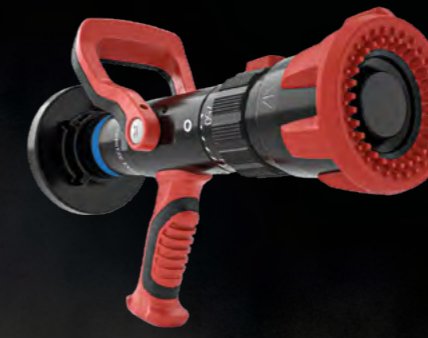
TURBO EVO 750 SPRITZE