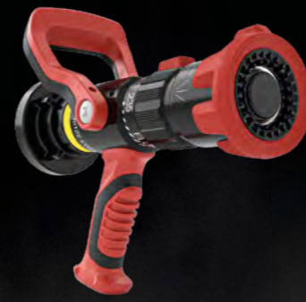
TURBO EVO 235 SPRITZE