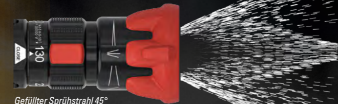
Gefüllter Sprühstrahl 45°