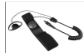
SAVOX® TM-1 mit Spiralkabel