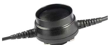
ASP-76 ohne und mit Tastenschutz