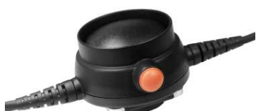
ASP-77 ohne und mit Tastenschutz