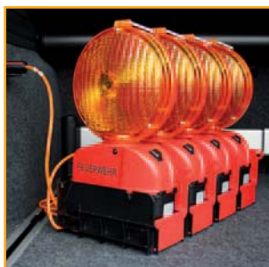
3. Laden im Kraftfahrzeug

Quickstart: Zum Einschalten wird die erste Leuchte der Ladeschale eingeschaltet. Die anderen Leuchten schalten sich automatisch ein. Die Synchronisierung der Lichtfolge erfolgt durch Infrarotdioden.