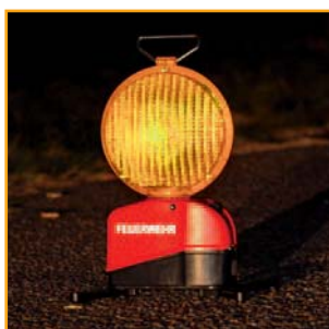
7. retroreflektierende Beschriftung

Am rechten oberen Leuchtenrand befindet sich unter der Linse eine LED-Statusanzeige . Diese zeigt die Ein- und Ausschaltfunktion und den Ladestatus an.