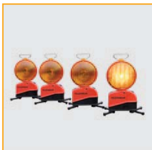
1. Aufbau als 4-fach Anlage

Die Star-Flash LED Typ 627 kann als Führungslichtanlage mit beliebig vielen Leuchten betrieben werden. Die Standfüße sind ausdrehbar und garantieren einen sicheren Stand bei z.B. Fahrtwind von vorbeifahrenden Fahrzeugen ( Standfläche 255 x 235 mm ).