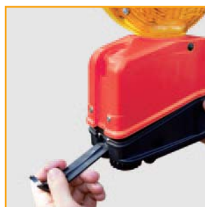
8. stabiler Schnellverschluss

Die Beschriftung auf beiden Seiten der Leuchten ist retroreflektierend und gibt nochmals eine zusätzliche Warnung im Einsatzfall, wenn sie z.B. von Autoscheinwerfern angestrahlt werden. Bei Tageslicht ist die Beschriftung schwarz.