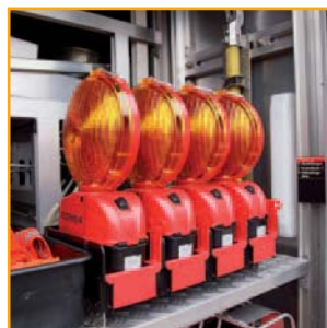
4. wenig Platzbedarf

Die Leuchten werden zum Aufladen der Akkus im Fahrzeug mit der Ladeschleife an die Kfz-Steckdose angeschlossen (Ladespannung 12-30 V). Die Betriebszeit beträgt ca. 70 Stunden .