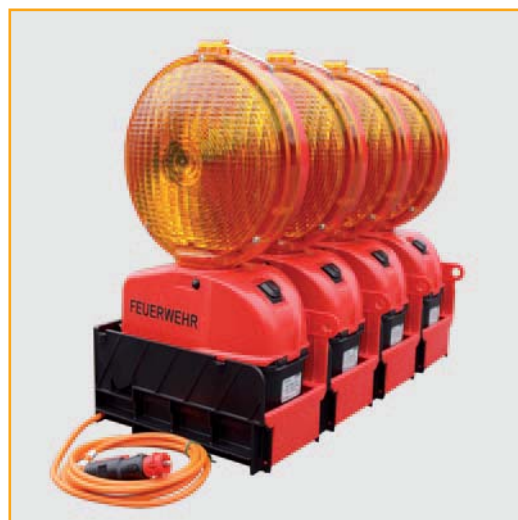
Leuchten als 4-fach Anlage in Ladeschale