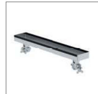
Wanne für Leiterprüfstand