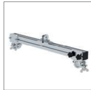
Seilführung für Leiterprüfstand