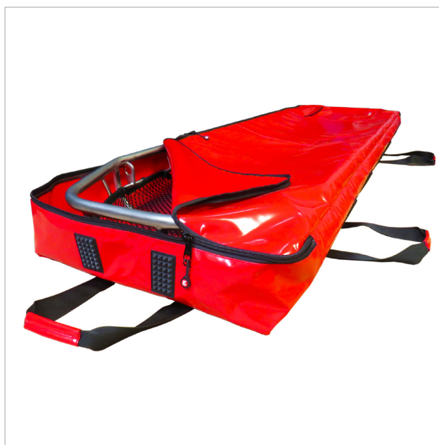
Trage- und Aufbewahrungstasche 387 für FERNO Korbtragen