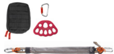
FALLSTOP® SET APAARR® SET4 Erweiterungssset