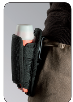
Holster für Sicherheits- Leuchten IL-3 / IL-3R, Artikel-Nr. B69-7271-A