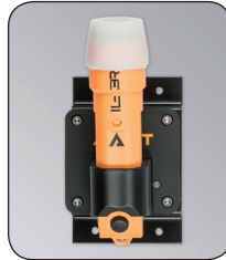
Ladegerät IL-3R, Artikel-Nr. B69-7412-A