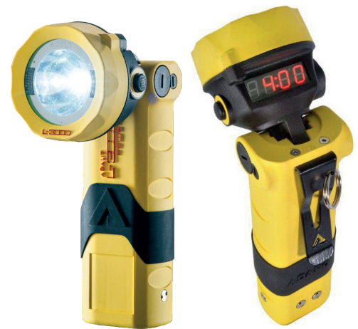
L-3000 POWER Art.-Nr. 253359

Hiermit müssen wir Sie über ein Schreiben des Herstellers der ADALIT Leuchten, die Fa. Adaro Tecnologia S.A., 33203 Gijón (Asturien), Spanien, über einen Rückruf von Li-Ion-Akkus der Leuchten L-3000 und L-3000 POWER mit Produktionszeitraum Januar 2016 bis Juni 2017 informieren. Es besteht die Gefahr der Überhitzung der Akkus beim Ladevorgang. Die Akkus der betroffenen Geräte werden vom Hersteller kostenlos ausgetauscht.