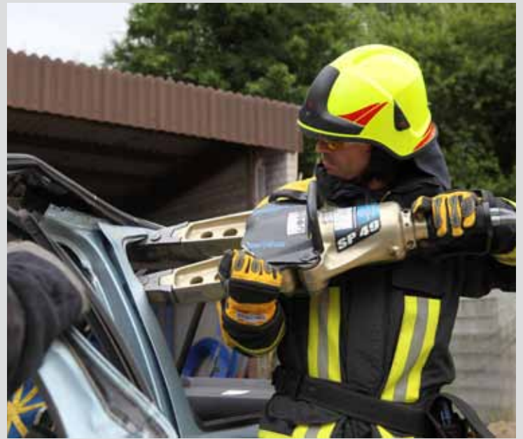
Abbildungen unverbindlich. Technische Änderungen vorbehalten. 09/10