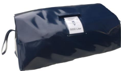
verpackt in Pocktasche mit zwei Trageschlaufen