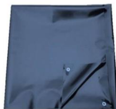
Unterlegplane als Zubehör erhältlich