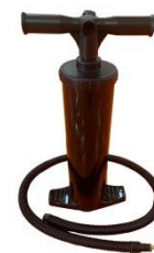
Doppelhubkolbenpumpe zum Befüllen des Schwimmwulstes als Zubehör erhältlich