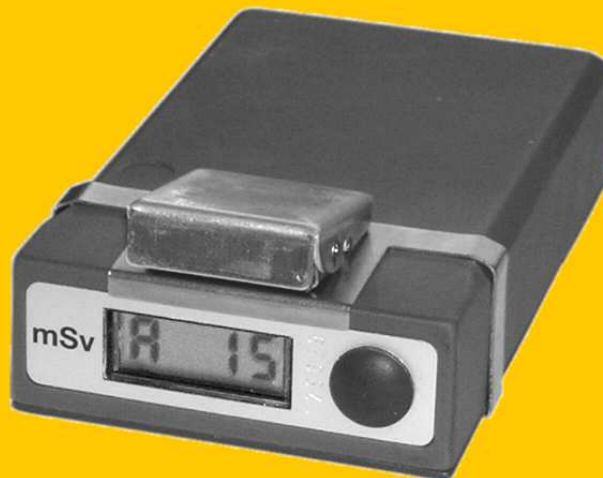
Anzeige der Dosiswarnschwelle

Außer der Dosiswarnschwelle lässt sich eine Vielzahl von Messwerten und Parametern anzeigen, die als Lauftext durch die vierstellige Anzeige wandern. Beispiele: