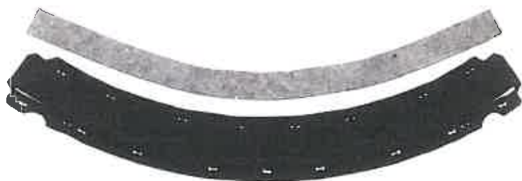
Ersatz-Öko-Schweissleder (Set) -neu- (für Drehverschluss und Standard)