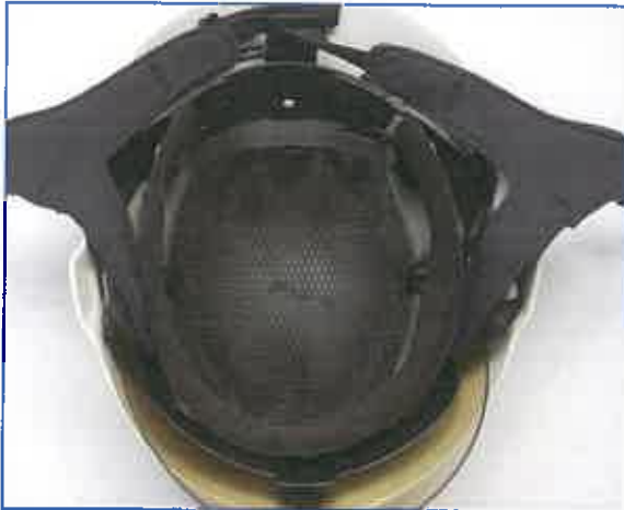
Helm - mit Kopfragering