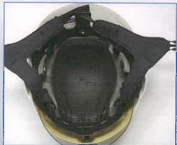
Helm - ohne Kopfragering

4) Kopfragering eine viertel Umdrehung nach links drehen und nach hinten abnehmen.