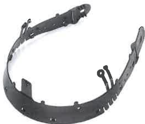
Ersatz-Kopftragering -neu- (für Drehverschluss und Standard)