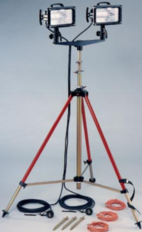
Stativ ST 4500