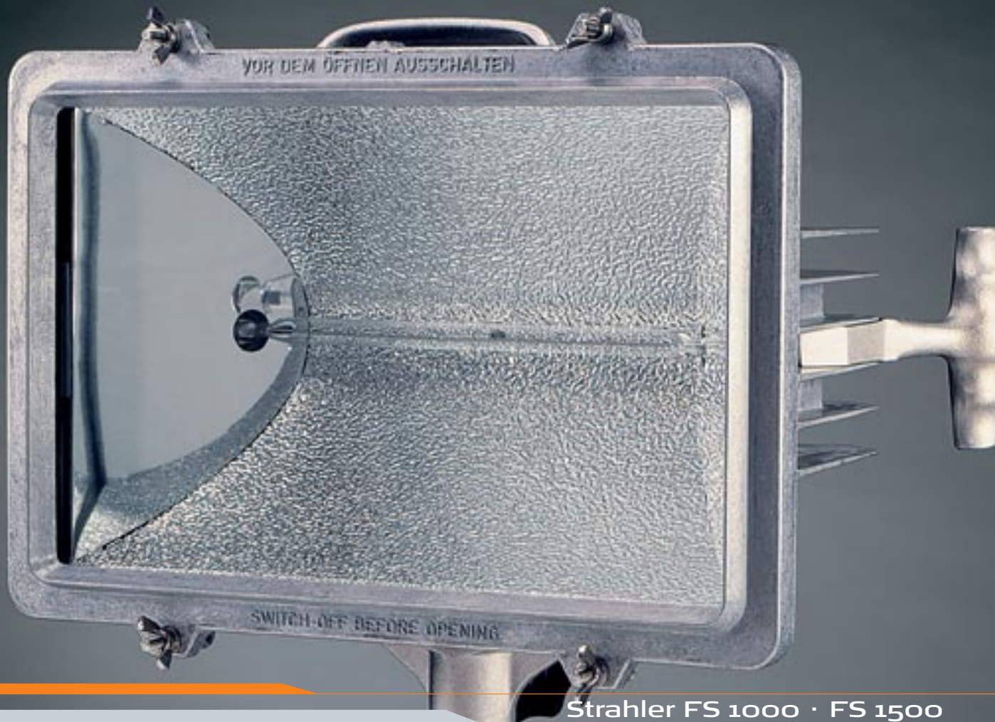
Strahler FS 1000 · FS 1500