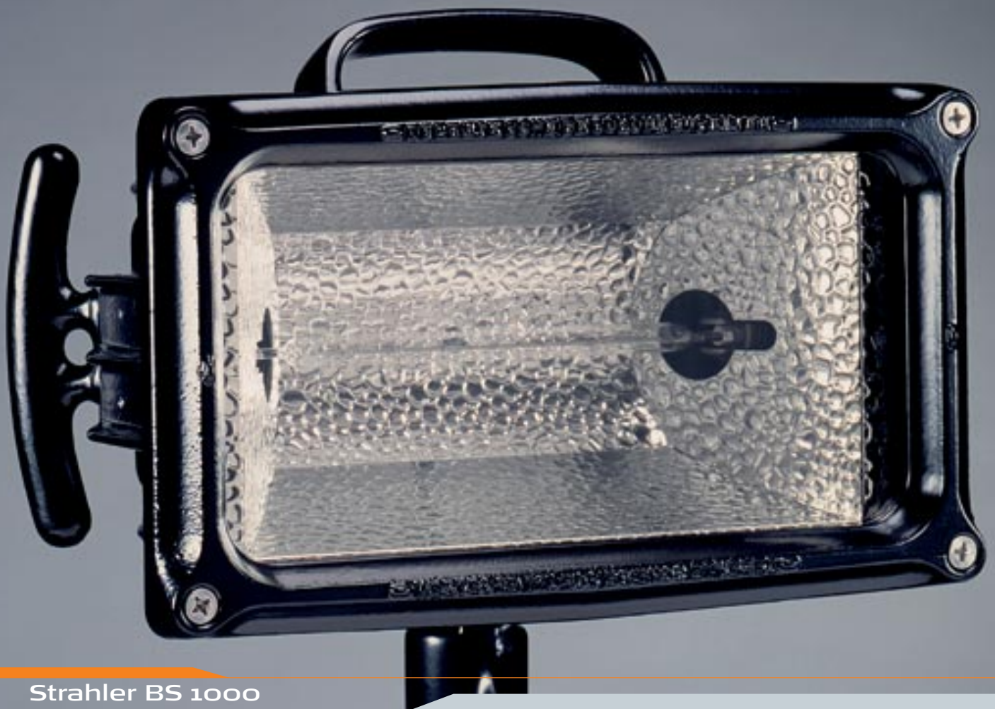
Strahler BS 1000