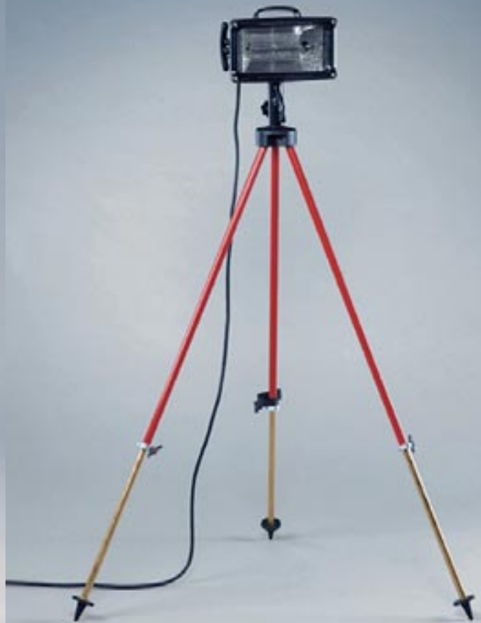
Stativ ST 1700