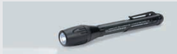
ART. 203478 LED-HANDLEUCHE 6141/61

Weiteres Zubehör für die Handleuchten der Reihe 6141 finden Sie auf r-stahl.com .