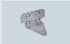
ART. 212332 WANDHALTER