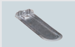
ART. 212331 GÜRTELHAKEN