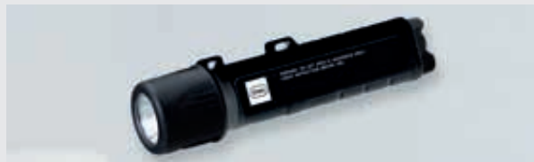
ART. 243788 LED-HANDLEUCHE/HELMLEUCHE 6141/62