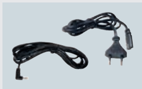
ART. 120014 LADEKABEL 230 V ART. 212316 LADEKABEL 12/24 V