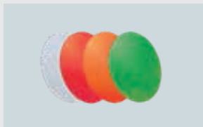
STREUSCHEIBEN ART. 212333 KLAR, ART. 212956 ROT ART. 212334 ORANGE, ART. 220306 GRÜN