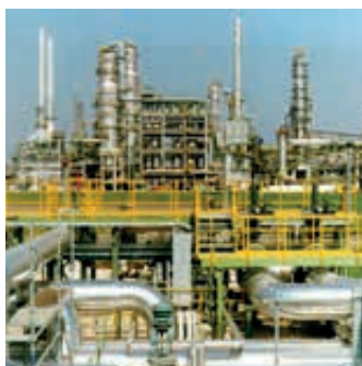
Petrochemie und Chemische Industrie