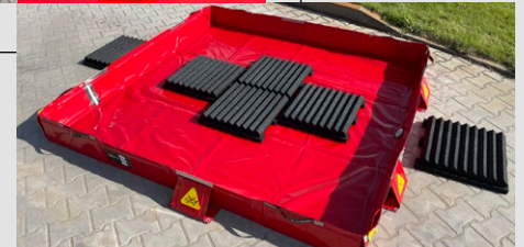
Die Matten haben eine spezielle Beschichtung gegen Wasseraufnahme