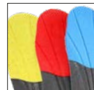
HAIX® Vario Wide Fit System