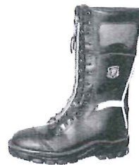
Schnürstiefel Art. 33326