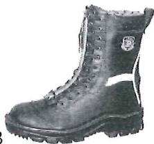
Schnürstiefel Art. 33323

4. Gegenstand der Erklärung (Identifizierung der PSA, die die Rückverfolgbarkeit ermöglicht; sie kann gegebenenfalls ein ausreichend scharfes farbiges Bild enthalten, wenn es zur Identifizierung der PSA erforderlich ist):