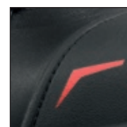
GÜK mit versenkten Nähten