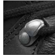
HAIX® 2-Zone Lacing