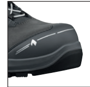
HAIX® Nano-Carbon Schutzkappe