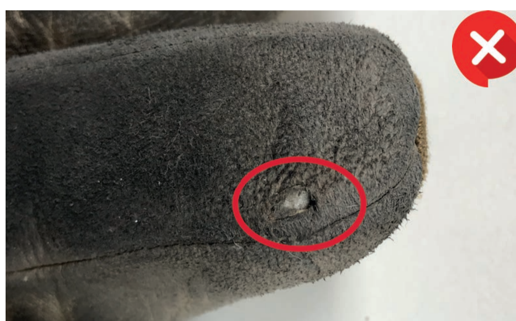
Loch im Leder