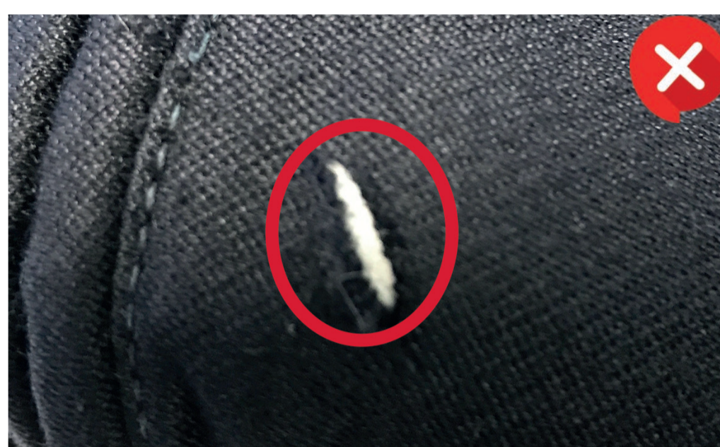
Loch durch Schnitt