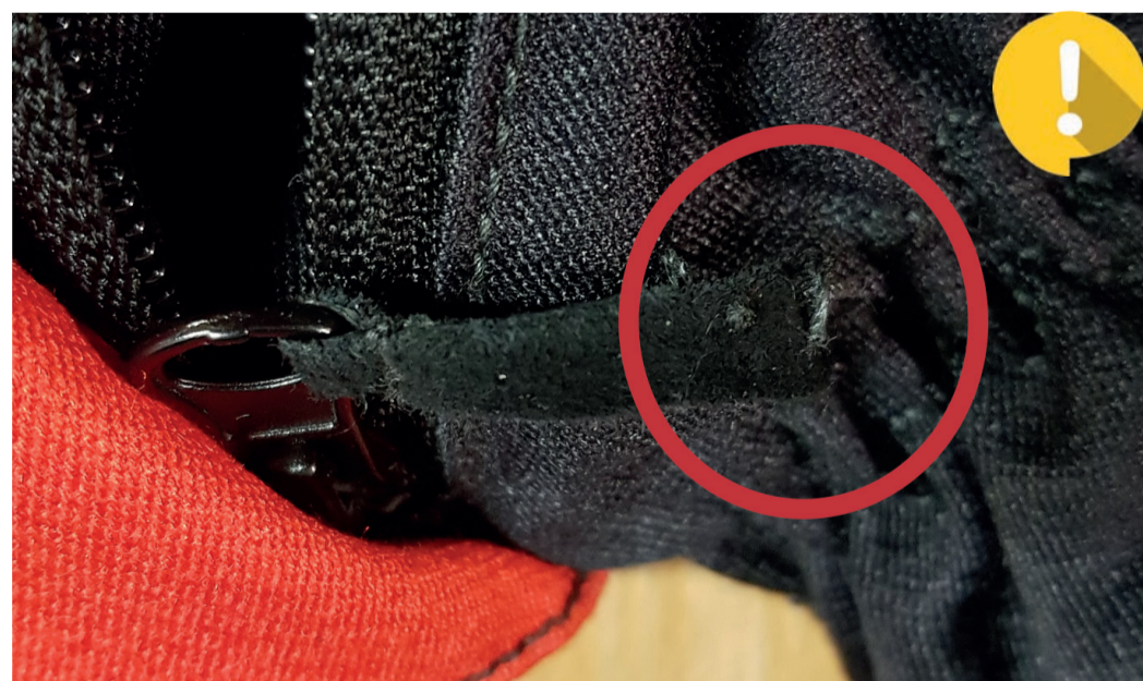
Verbindung Reißverschluss / Klettverschluss gerissen