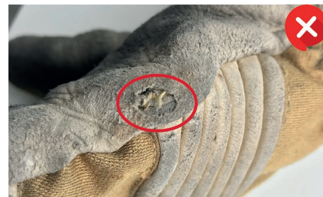
Loch durch Abrieb