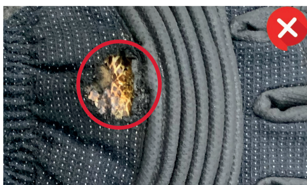
Loch durch flüssiges Metall