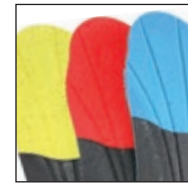
HAIX® Vario Wide Fit System