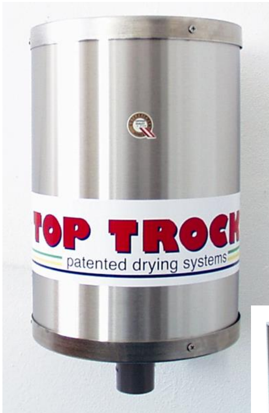
Maße: \varnothing = 20 cm, H = 35 cm

Das TOP TROCK bürstenlose Warmluftgebläse GF 900 kann für alle TOP TROCK Trockensysteme verwendet werden. Das GF 900 kommt speziell dort zum Einsatz, wo es gilt, besonders feuchte Stiefel, Handschuhe, Arbeitskleidung etc. professionell zu trocknen.