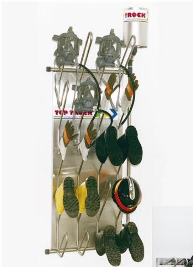
Trockenpaneel mit 20 Bügeln

Unsere Trockenpaneele mit 10, 20, 30 od. 40 Bügeln ermöglichen eine schnelle und schonende Trocknung von Schuhen, Stiefeln, Handschuhen und Atemmasken. Die in Rohren geführte Warmluft gewährleistet eine schonende und zuverlässige Trocknung der Gegenstände von innen, dadurch erhöht sich die Lebensdauer auf das zwei- bis dreifache.