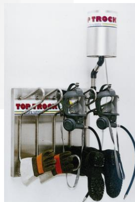
Trockenpaneel mit 10 Bügeln

10 Bügeln: B 77 x H 89 x T 48 cm 20 Bügeln: B 61 x H 205 x T 48 cm 30 Bügeln: B 86 x H 205 x T 48 cm 40 Bügeln: B 86 x H 205 x T 48 cm