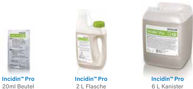
Indicin™ Pro 20ml Beutel

Flüssiges Konzentrat zur Reinigung und Desinfektion.