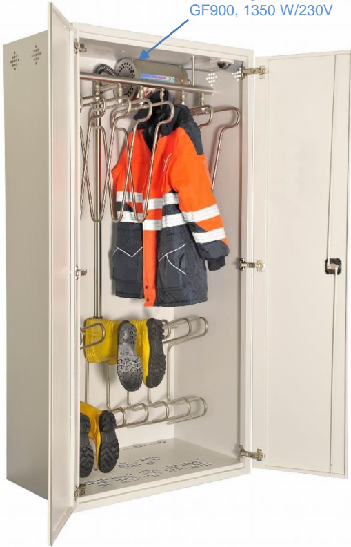
Warmluftgebläse GF900, 1350 W/230V