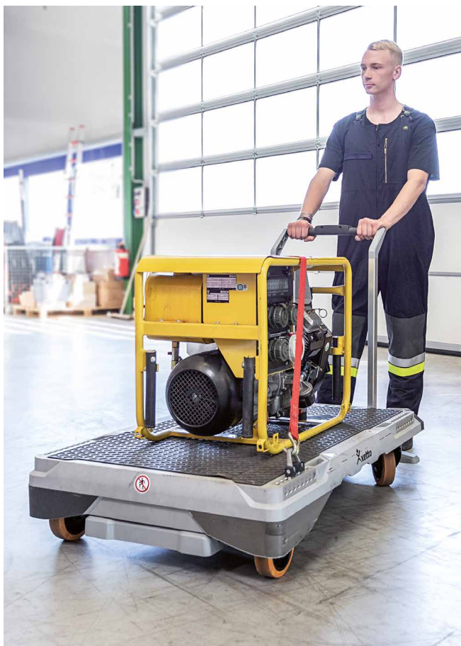
Abb. Bestell-Nr. 120080