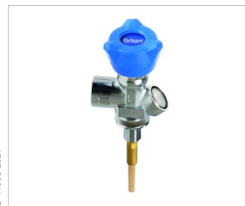
Rechtwinkliges Ventil (mit Abströmsicherung) nach EN144:2018