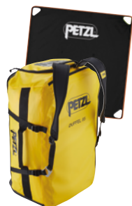
DUFFEL BAG 85 l Rucksack & Seilplane