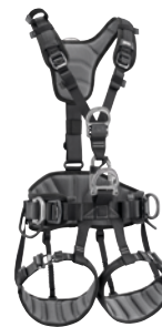
AVAO FAST Auffang- & Haltegurt