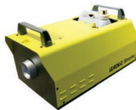
LEADER Smoke 3