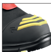
HAIX® High Durability Cap System