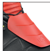
HAIX® 3Z Protector System