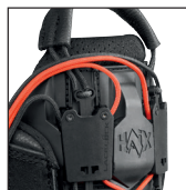
HAIX® RAPIDFIT System